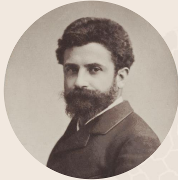
Jacques Bertillon 1851 - 1922