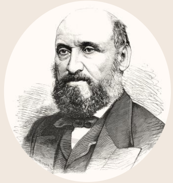
William Farr 1807 - 1883